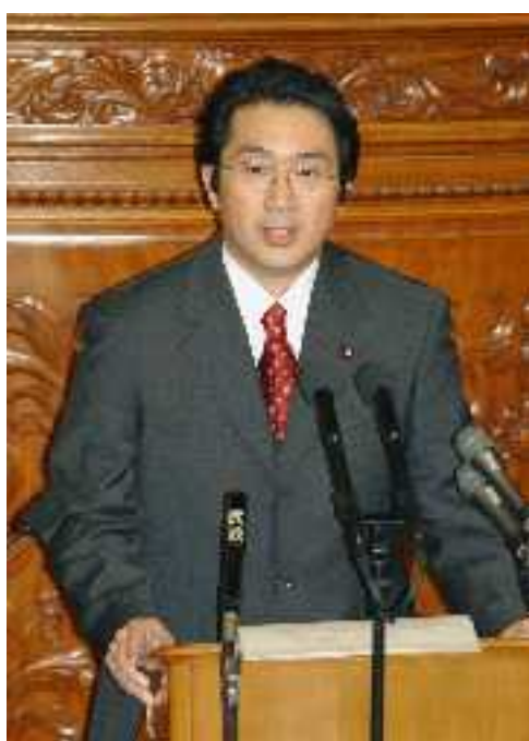
衆議院本会議場で政府に対し「代表質問」