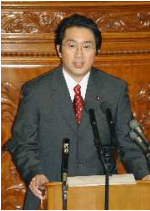
衆議院本会議場で政府に対し「代表質問」