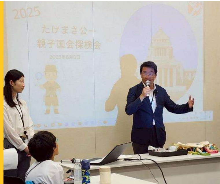
親子国会見学会 にて説明中